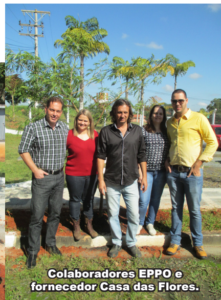
Colaboradores EPPO e fornecedor Casa das Flores.