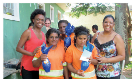
Unidade Cidade Nova