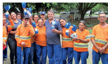
Unidade São Roque